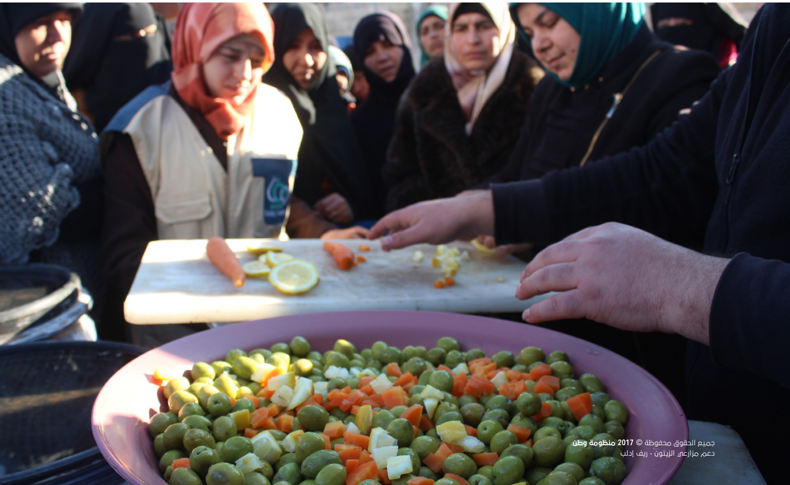
جميع الحقوق محفوظة © 2017 منظومة وطن دعم مزارعي الزيتون - ريف إدلب