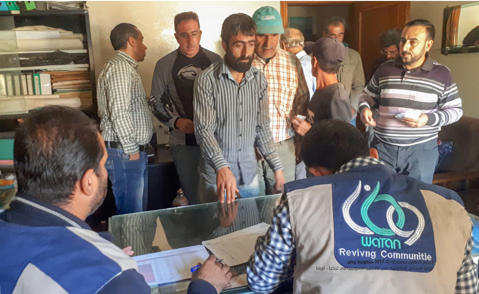
توزيع قسائم الكترونية على اللاجئين السوريين في تركيا